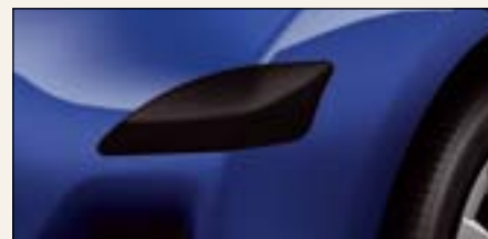
Nakładki ochronne na narożniki zderzaków