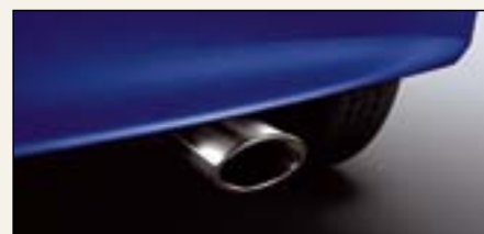
Końcówka rury wydechowej