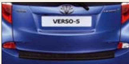
Listwa ochronna na tylny zderzak