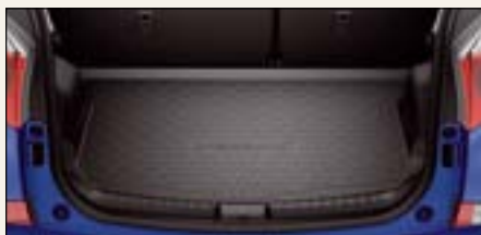
Gumowa wykładzina bagażnika