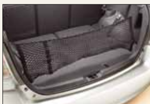
Pionowa siatka na ładunek