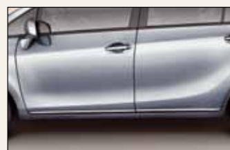
Chromowane listwy boczne