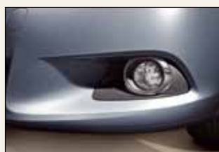
Chromowana obudowa lamp przeciwmgielnych (nie dotyczy wersji Luna)