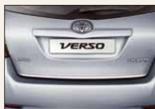
Chromowana listwa na klapę bagażnika