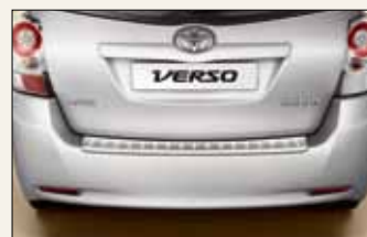
Nakładka ochronna na tylny zderzak

DOPEŁATA DO WERSJI 7-MIEJSCOWEJ TYLKO 1 000 PLN