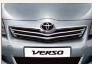
Chromowana listwa na grill